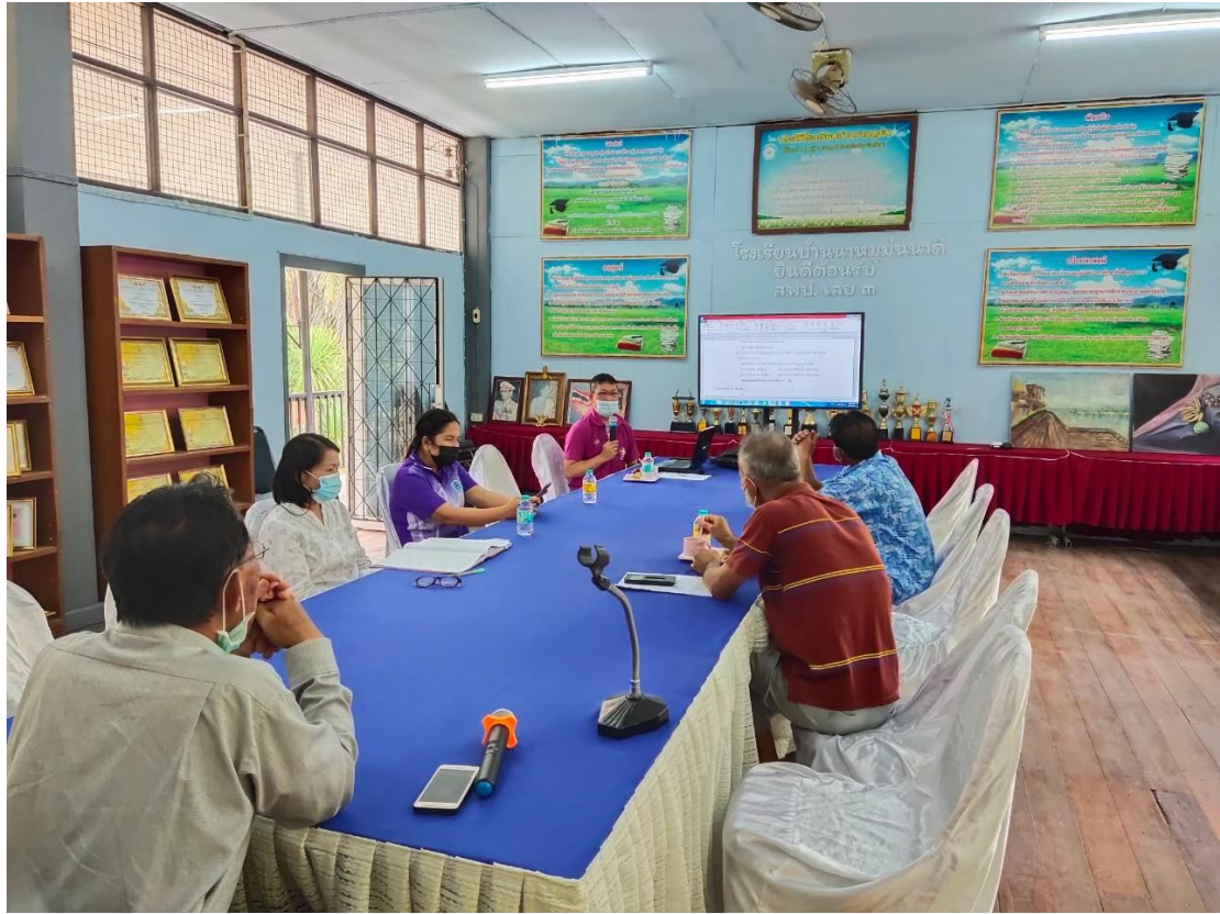
การประชุมคณะกรรมการสถานศึกษา